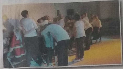
Der Applaus während und nach den Tänzen und einigen Tränen der Zuschauer zeigte, dass es allen gefallen hat. Glücklich und zufrieden wurde am Abend der Sportlerball gefeiert und alle in ihre wohlverdiente Weihnachtspause geschickt.

den Weihnachtstänzen aller Gruppen, bis zu einer Liebeserklärung der Muttis an ihre Kinder war unsere Show abwechslungsreich und gelungen.