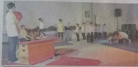
Mit 13 Vorschulturnern, 12 kl. Gymnastinnen, 8 Dance-Kids und 5 Fitness-Frauen startete die Weihnachtsshow.

Ein Wochenende später traten 10 Mädchen in Ueckermünde, bei der Weihnachtsturngala des Vereins auf. Auch dieser Tag war für die teilnehmenden Tänzerinnen anstrengend, werden in Ueckermünde doch 2 Veranstaltungen gezeigt. Für ihren Tanz „Am Fenster“ bekamen sie vom Publikum ordentlich Applaus. Nach diesem Auftritt ging es in Gültz beim Training hoch her, 14 Tage nur noch bis zu unserer Vorführung. So wurde in allen Abteilungen kräftig trainiert, neue Tänze noch gelernt, Auftrittskleidung noch geklärt. Aufregung pur. Am Freitag fand dann noch die Generalprobe statt, welche bekanntlich ja nicht klappt. Dann war es soweit, der 12.12.15.